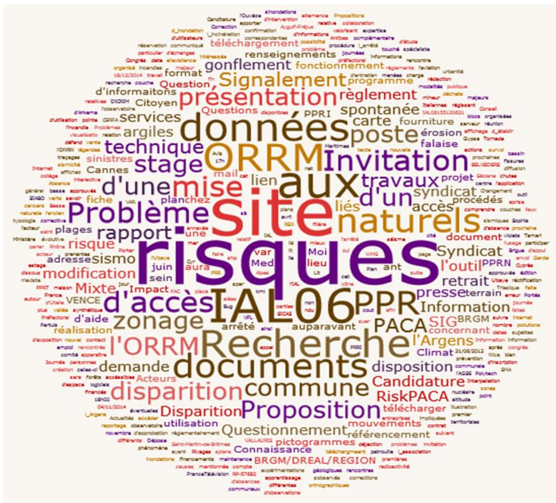
Illustration 3 : Nuage de mots représentant les sujets abordés par les Internautes ayant écrit sur les adresses observatoire-risques@brgm.fr et riskpaca@brgm.fr