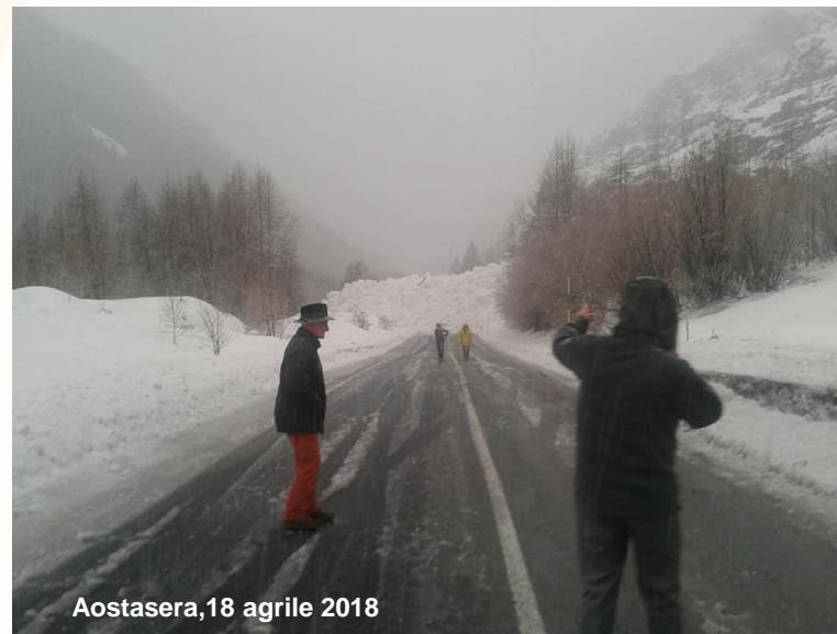
Aostasera, 18 aprile 2018

Ambito di studio Regione Valle d'Aosta 10 Comuni Valdostani